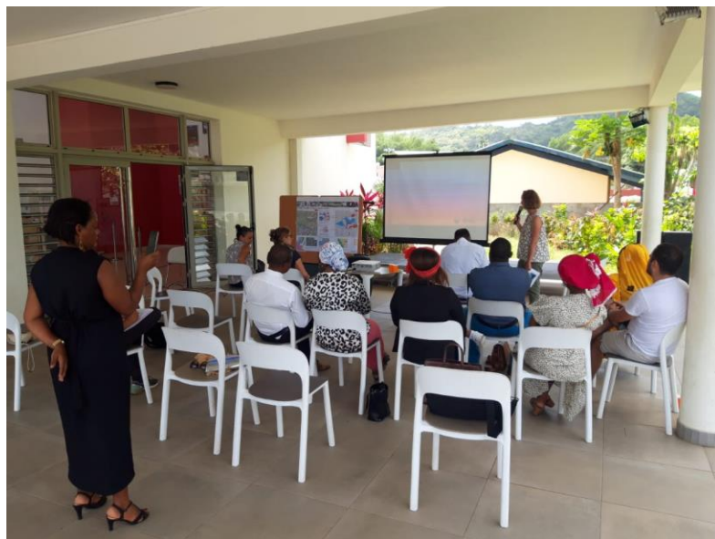
Photo de la réunion d'information

Moins de 10 personnes étaient présentes à la réunion d'information.